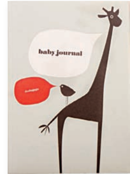
SÜSS: BABY-JOURNAL VON WWW.PLEASETOMEET.DE, UM 24 EURO.