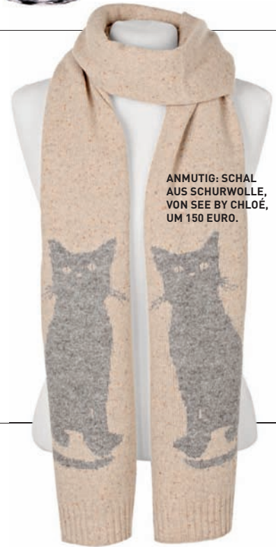
ANMUTIG: SCHAL AUS SCHURWOLLE, VON SEE BY CHLOÉ, UM 150 EURO.