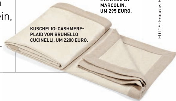
KUSCHELIG: CASHMERE-PLAID VON BRUNELLO CUCINELLI, UM 2200 EURO.