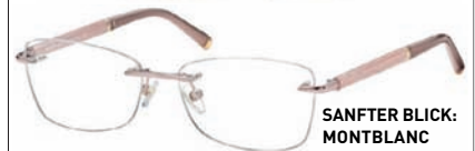
SANFTER BLICK: MONTBLANC EYEWEAR BY MARCOLIN, UM 295 EURO.